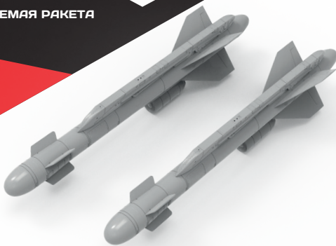
Highly detailed missile X-59MK

To attach resin parts use cyanoacrylate glue. Для склеивания деталей использовать цианоакрилатный клей